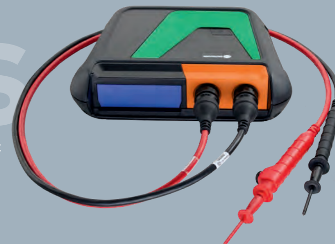
bestehend aus MT-HV + Hochvolt-Messleitungen schwarz/rot