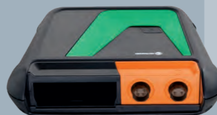
bestehend aus MT-HV